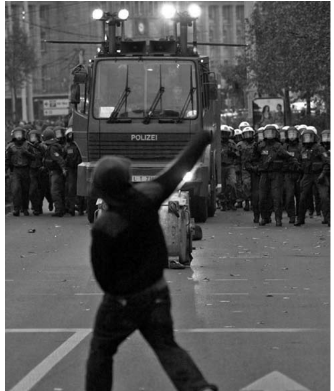
Am Rande eines Neonazi-Aufmarsches in Leipzig stellt sich ein linksautonomer Gegendemonstrant einem anrückenden Wasserwerfer der Polizei entgegen (November 2001).