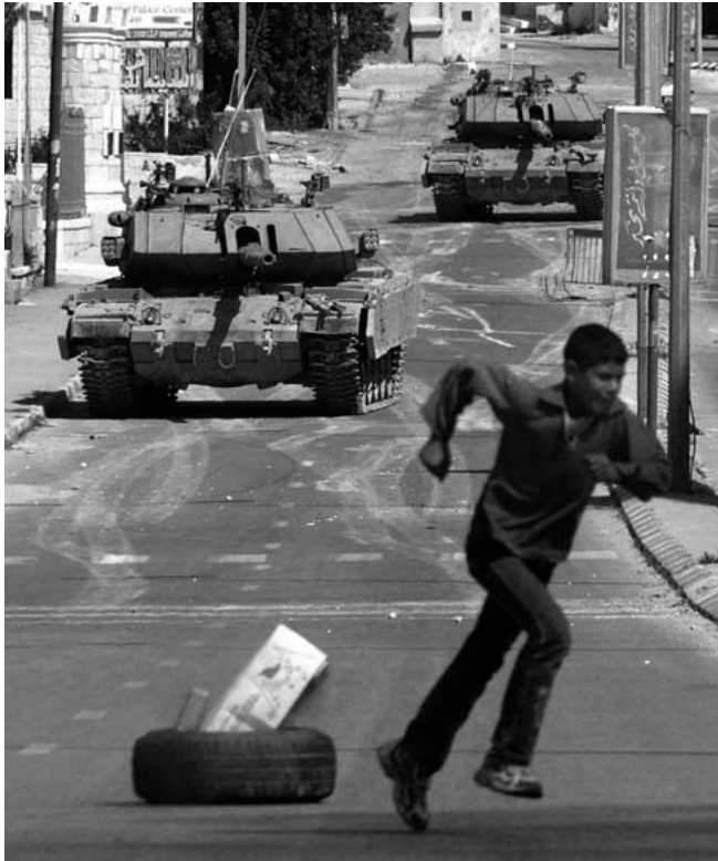
Ein palästinensischer Junge flieht vor israelischen Panzern, die nach Bethlehem vorstoßen (März 2002).