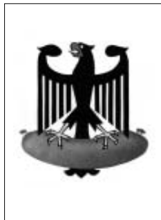
Plakate: Klaus Staeck

Wie wirken diese Plakate (die 1995 und 1989 entstanden sind) auf Sie?