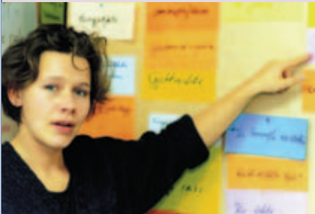
Friedensfachkraft beim Albanisch-Kurs

Angesichts der Konflikte und Kriege in der Welt sind viele Menschen bereit, sich persönlich auf unterschiedliche Weise direkt für eine friedlichere Welt einzusetzen. Wie könnten Sie sich persönliches Engagement heute, wie später vorstellen? Wie bewerten Sie die hier aufgeführten unterschiedlichen Ansätze für die Konfliktbearbeitung?