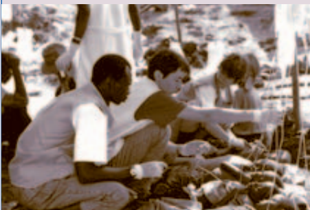
Notärzte in Zaire