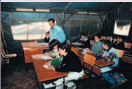
Klassenzimmer in Bare/Mitrovica