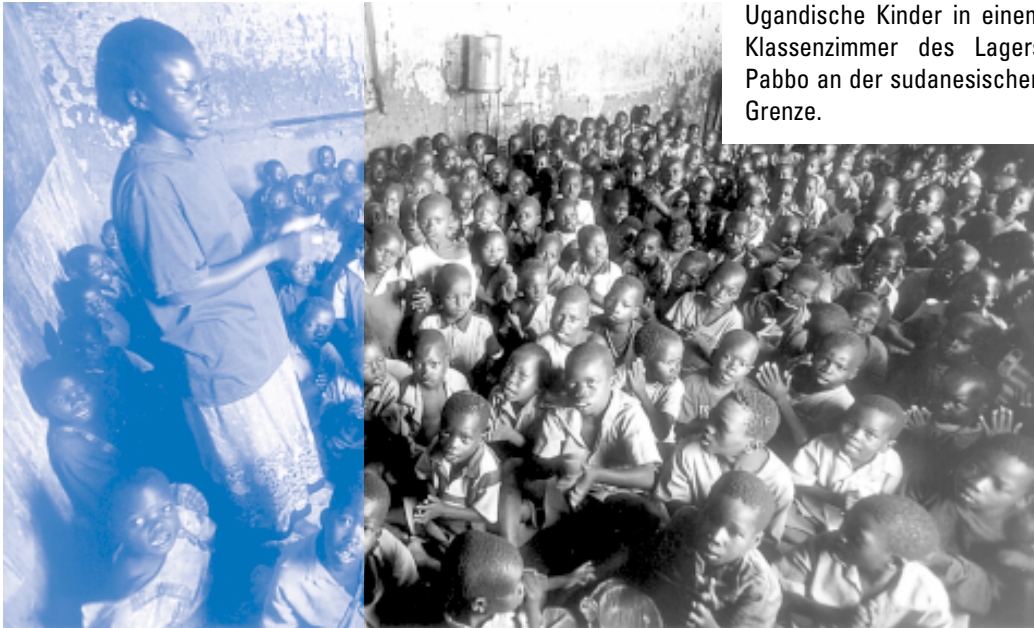
Ugandische Kinder in einem Klassenzimmer des Lagers Pabbo an der sudanesischen Grenze.