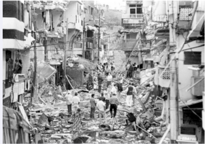
Kolumbien: Zerstörte Häuser nach einem Terroranschlag

Terrorismus ist der Einsatz unberechenbarer Gewalt zur Erreichung eines politischen Zielles. Er ist die fatale Fortsetzung eines gescheiterten oder unmöglichen politischen Dialogs. Insofern hat Terrorismus immer eine gesellschaftliche Basis, ohne die er nicht operieren kann. (...)