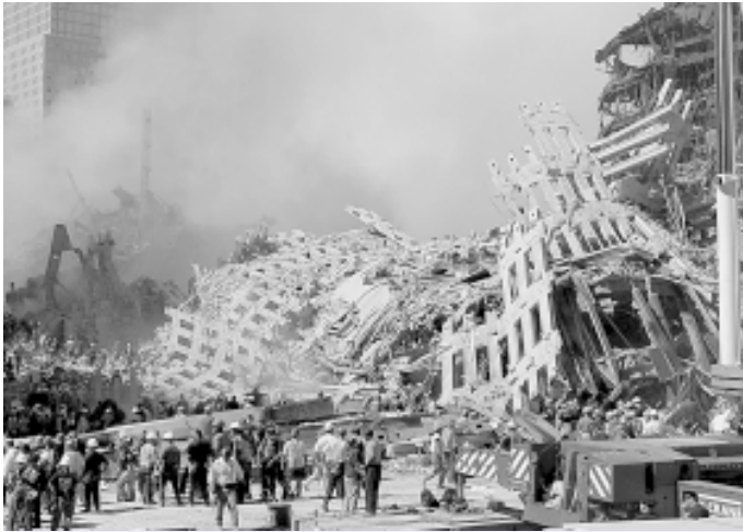
New York: Nach dem Anschlag auf das World Trade Center